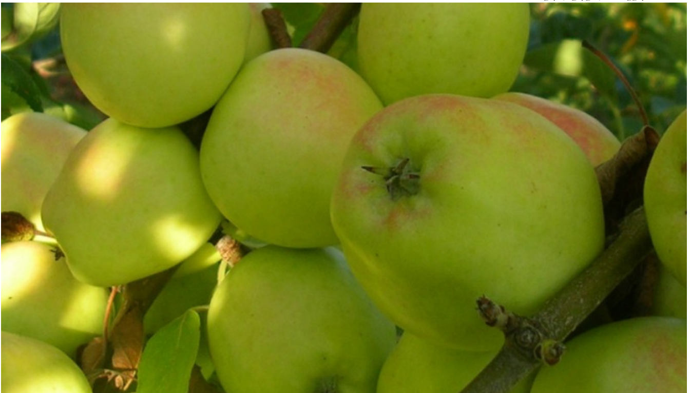
LA MELA LIMONCELLA

GAL Meridaunia, Università degli Studi di Foggia, Azienda agricola Calitri, Coop. La Croce-Farascuso, Cassandro srl, Alimenta srl, DARE, Aretè, Comune di Orsara di Puglia), con la società cooperativa Conapo, soggetto capofila.